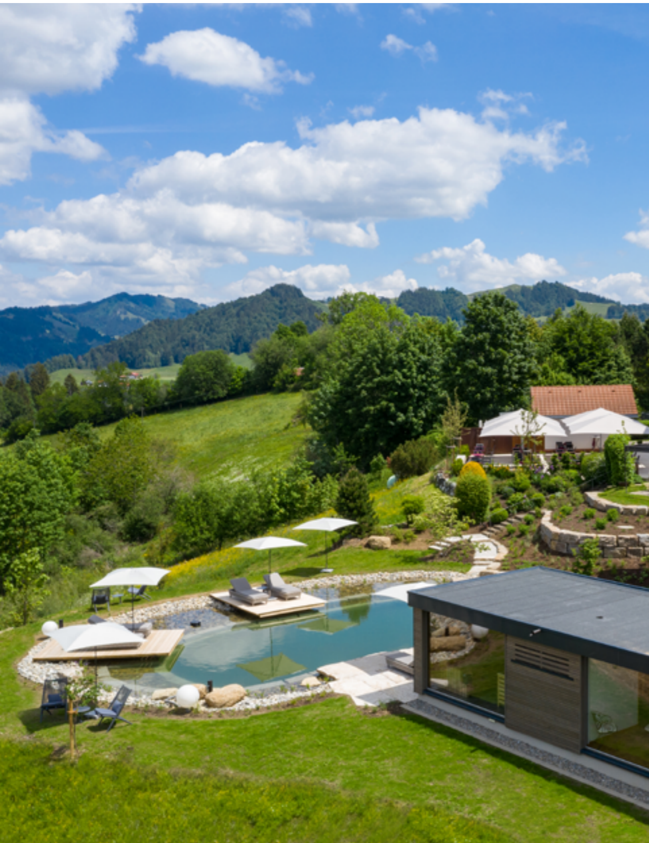
WEITBLICK. Vom Schwimmteich auf die Allgäuer Alpen blicken und durchtamen.